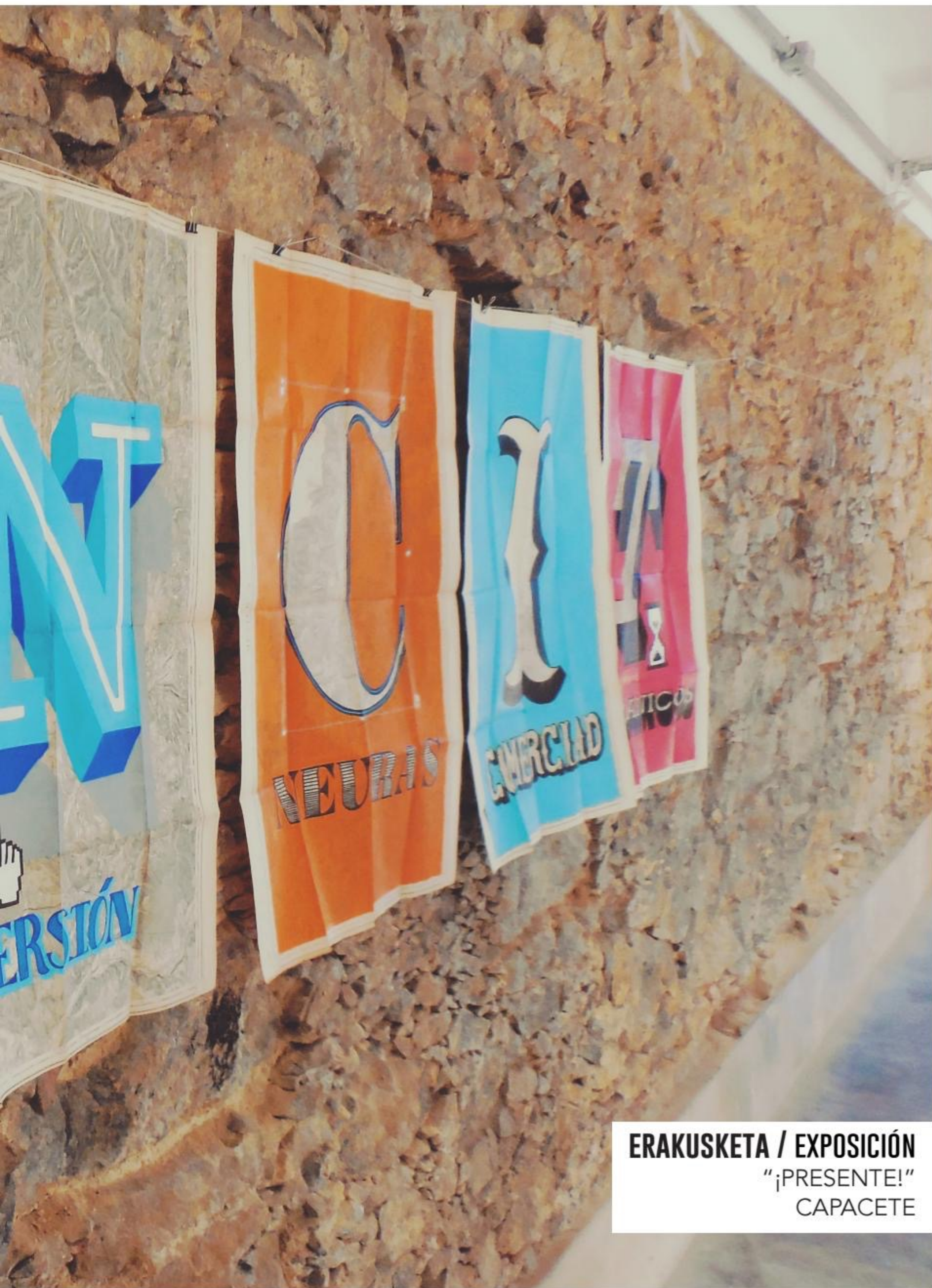
ERAKUSKETA / EXPOSICIÓN "¡PRESENTE!" CAPACETE