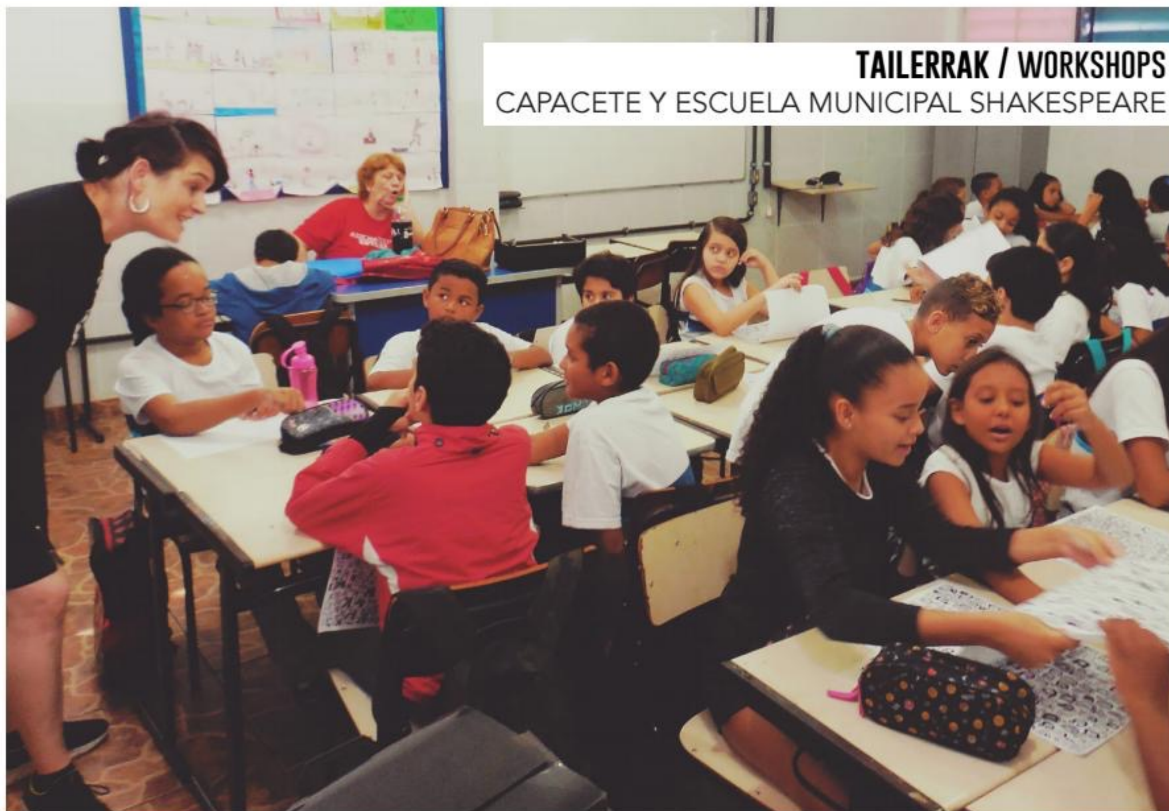
TAILERRAK / WORKSHOPS CAPACETE Y ESCUELA MUNICIPAL SHAKESPEARE