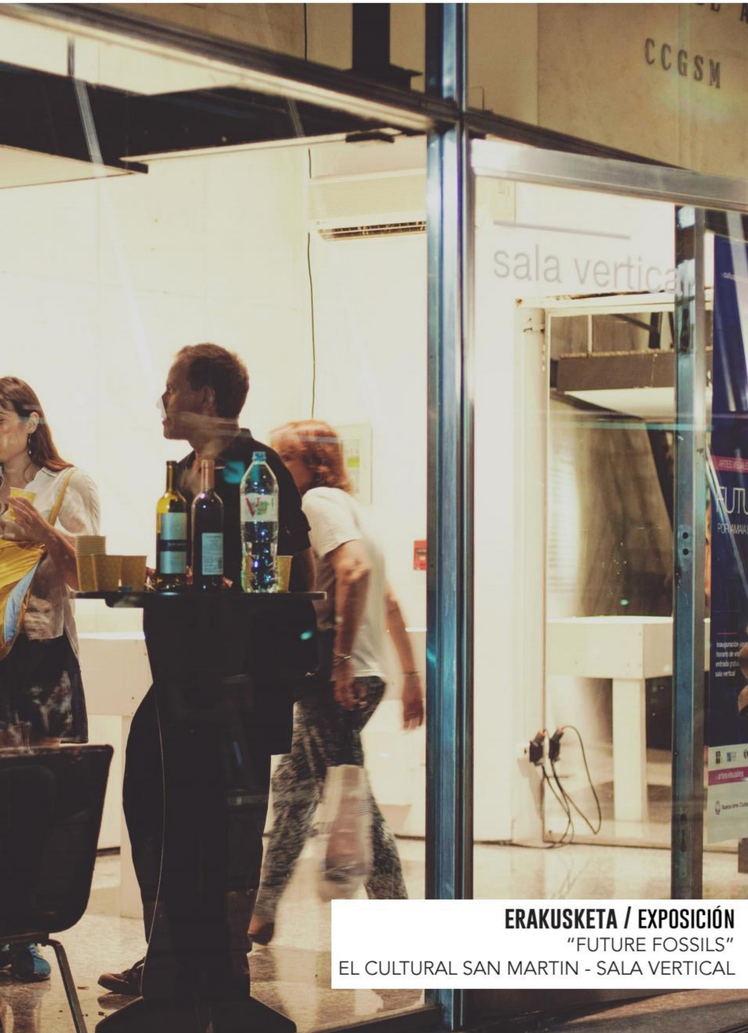
ERAKUSKETA / EXPOSICIÓN "FUTURE FOSSILS" EL CULTURAL SAN MARTIN - SALA VERTICAL