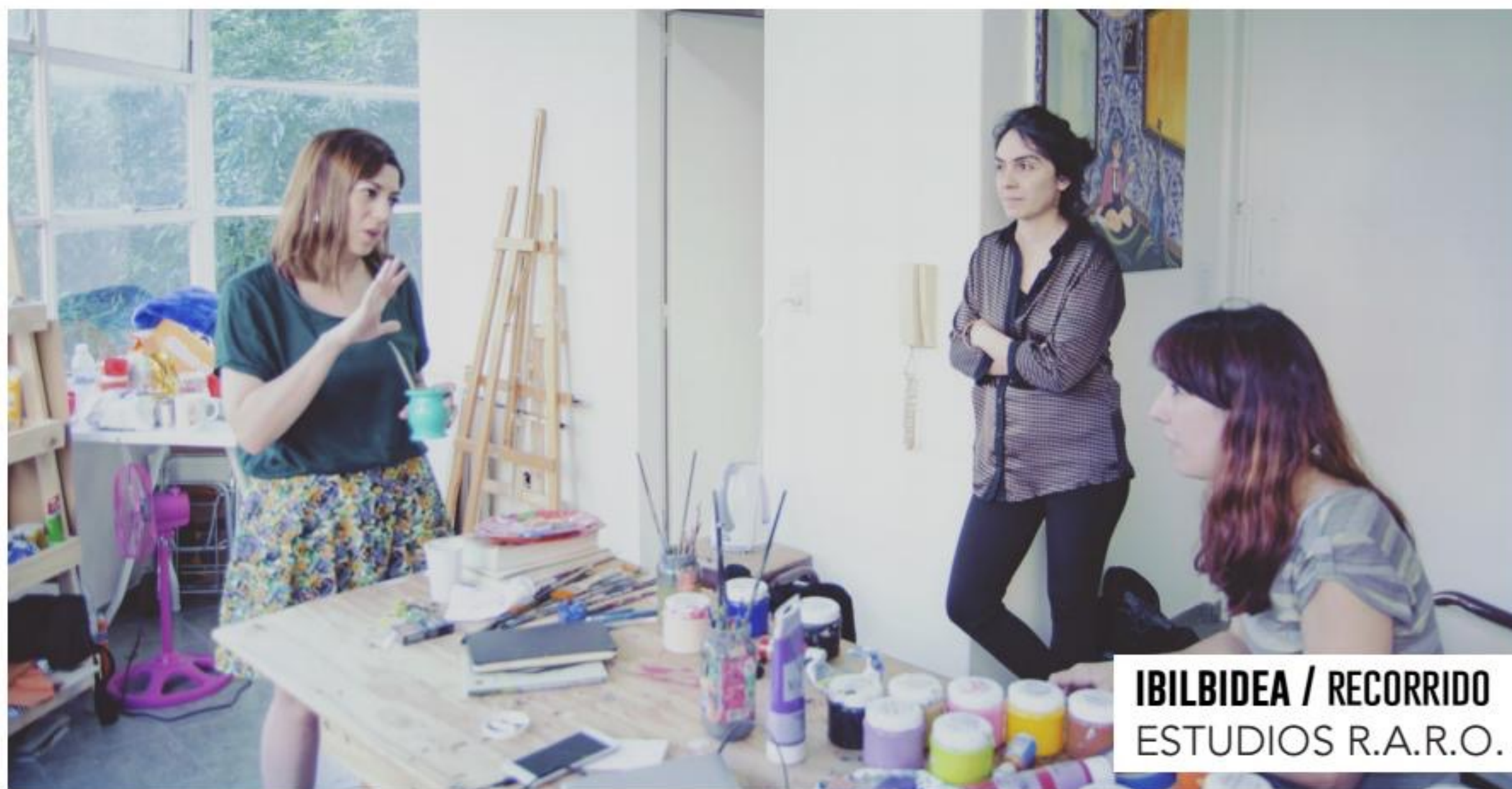
IBILBIDEA / RECORRIDO ESTUDIOS R.A.R.O.