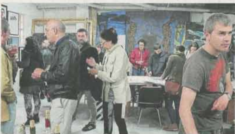
Distintos momentos del antes y el durante de la primera edición de Superstudio.