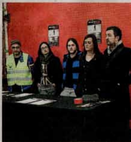
Presentación del congreso Inmersiones, de arte emergente. :: EL CORREO

'Re (in) sistencia' fue la denominación que acogió en 2014 al con-