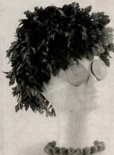
Pelo de perejil, gafas cítricas y collar de aceitunas.