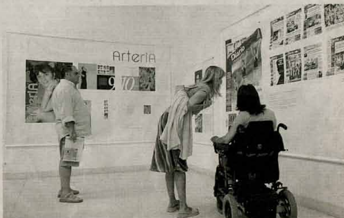
Varias personas observan las composiciones de la muestra.

visita. "Se van a plantear que no es una cosa tan superficial y tan frívola como aparentemente parece. Por lo menos sí que estamos seguras de que la gente va a salir con buen sabor de boca", apuntilla Calzada. Un sabor como el que deja un buen dentífrico, que también necesita de un buen diseño. Fijense en el tubo después de comer.