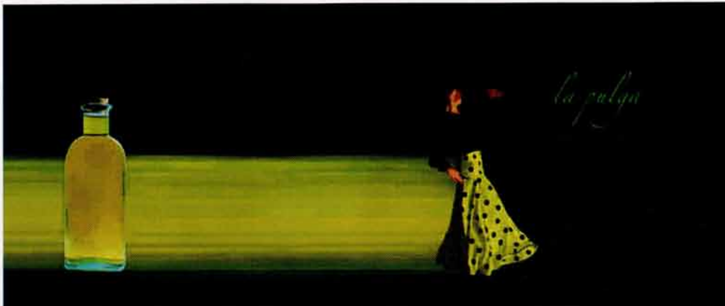
Tres de las propuestas de 'Anónimo y desconocido'