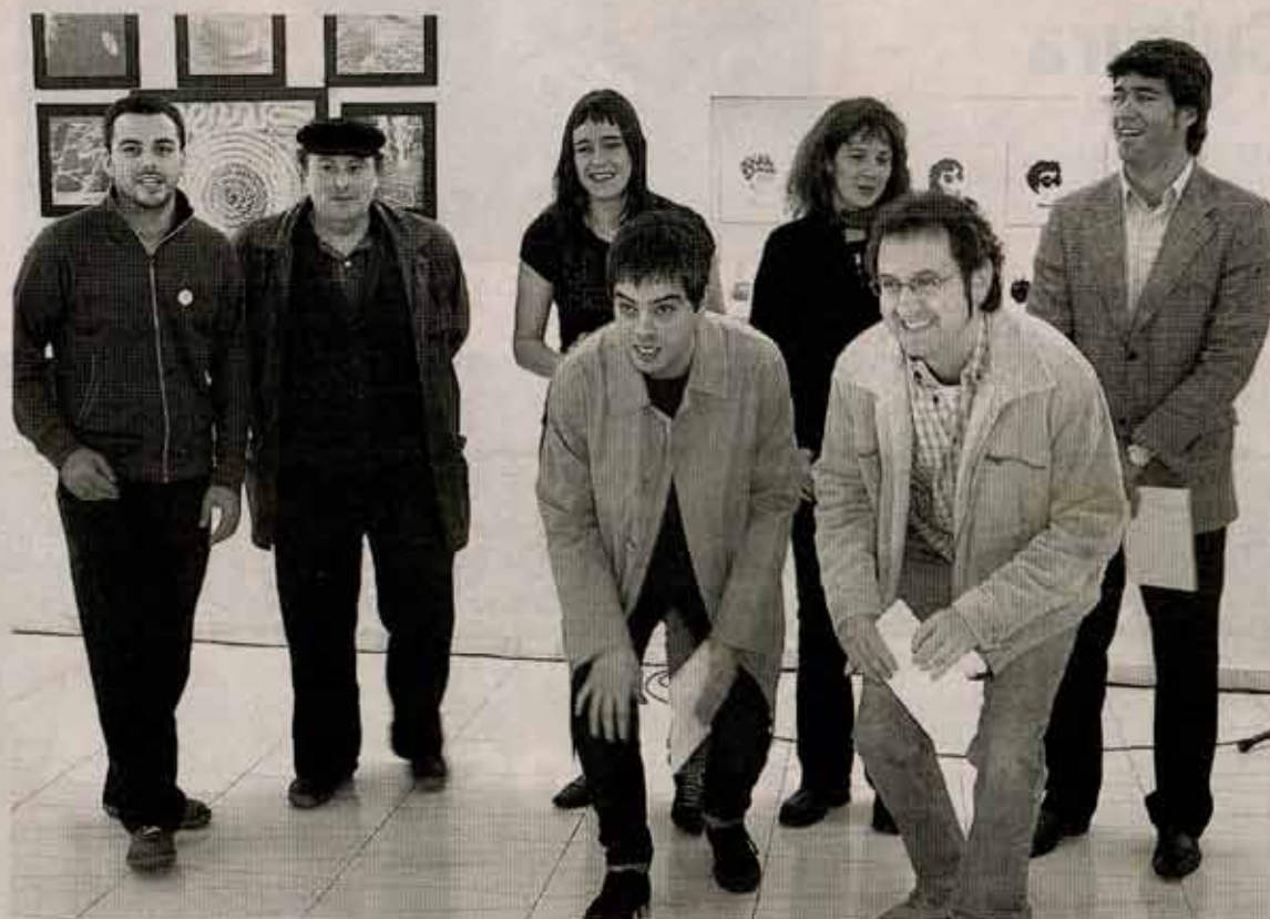
PREMIOS. Los autores galardonados en el certamen, en la sala Luis de Ajuria.

La estética y el humor se unen en la obra 'Fruturama (La fruta