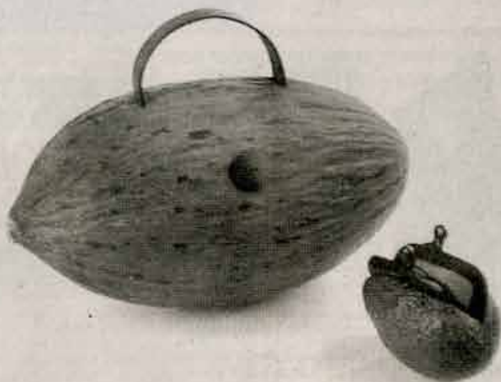
El bolso melón y la cartera aguacate combinan a la perfección.