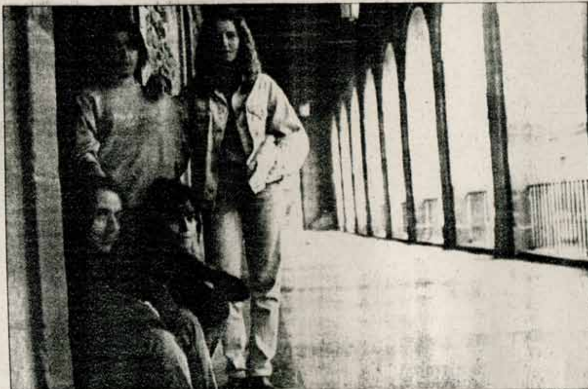
Las cuatro alumnas de Mendizabala que han obtenido el premio en Valencia.

Para estas jóvenes y, en este caso afortunadas realizadoras, lo más importante de su trabajo es el tema y el mensaje que reflejan en el documental: los obstáculos y dificultades que tienen los artistas más jóvenes para dar a conocer sus creaciones y sus trabajos, ya sea en la música, las artes plásticas o cualquier otra faceta del arte. «Mucha gente de la que no llega a triunfar, sobre todo si es joven, es porque carece de los medios apropiados y porque la sociedad no ayuda y sólo se ocupa de los famosos», afirmaron.